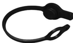
Serie-AG Tapón Protector Para Cople Intercambio Agrícola