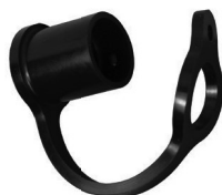
Serie-AG Tapa Protectora Para Niple Intercambio Agrícola